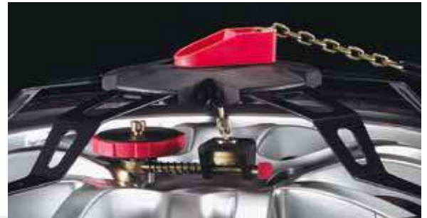
Il dispositivo speciale di blocco della catenella realizzato in nylon rinforzato con fibra di vetro consente la regolazione ottimale dell'ancoraggio e fornisce la migliore spinta elastica alle braccia. Brevetto nr. EP 0226131

Per esercitare una buona aderenza, ogni dispositivo antisdrucchiolo deve presentare continuità d'azione lungo l'intero battistrada. Le speciali placche chiodate ad alto grip in materiale plastico raccordano la crociera portante con la tratta di catena, stabilizzano il sistema e formano una più ampia superficie di aderenza col pneumatico. La guida pertanto risulta confortevole e sicura senza fastidiosi fenomeni di risonanza e vibrazioni. Brevetto nr. 385243