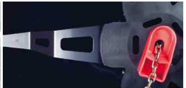
Il morsetto di serraggio viene realizzato con la miglior tecnologia ed i migliori materiali disponibili oggi sul mercato. Brevetto nr. PCT/IB03/02898